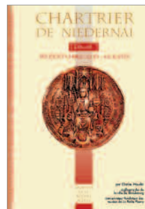
recueil de chartes, papiers et sceaux médiévaux client : Région Alsace