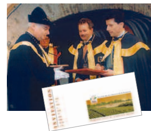
événementiel : journées de dégustation professionnelles client : syndicat viticole des Premières Côtes de Bordeaux