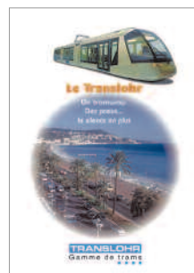
plaquette marketing en faveur du Translohr client : Lohr industries