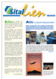
journal d'entreprise communication interne client : Sital