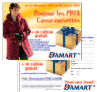
campagne de publicité soldes 2002 - Lausanne et adaptation de catalogues client : Damart Swiss AG