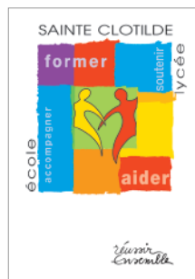
plaquette et chemise institutionnelles client : Lycée Sainte Clotilde