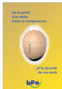
plaquette institutionnelle fabricant de boîtes à œufs client : BPO