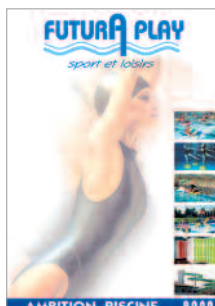
catalogue commercial vente de matériel de piscines client : Futura Play