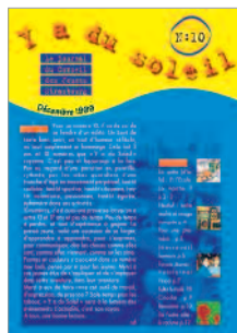
journal "Y a du soleil" du Conseil des Jeunes client : Ville de Strasbourg